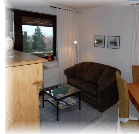
Wohnbereich, mit Schlafsofa, SAT-TV, Radio – CD.

Schon beim Frühstück genießen Sie den Blick über den Deich auf das Wattenmeer und die Inseln.