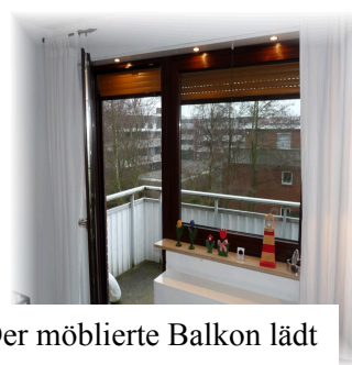
Der möblierte Balkon lädt zum Verweilen und Träumen ein!

Neben der FEWO stehen Ihnen ein PKW - Stellplatz sowie ein Fahrradkeller zur Verfügung. 300 m bis zur Ortsmitte, 1200 m zum Meer.