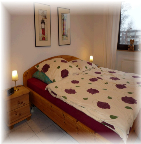
Schlafzimmer mit Doppelbett.

Belegung: 2 Erwachsene 2 Kinder, bzw. 3 Erw. Haustiere auf Anfrage