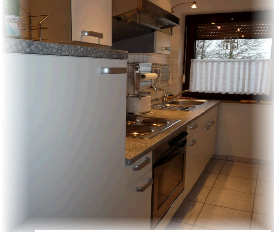
Die zweckmäßig eingerichtete Küche mit E-Herd.

Die im zweiten Obergeschoß liegende Nichtraucher FEWO ist wie folgt ausgestattet.