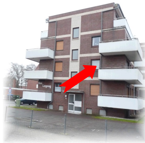
Haus Langeoog im Nordseebad Dornumersiel ( Nationalpark Niedersächsisches Wattenmeer).